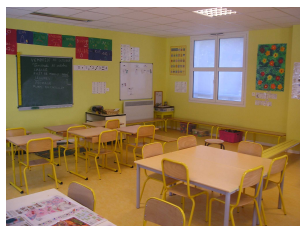
(Nouvelle classe maternelle)

Elle signera officiellement avec celui-ci une convention d'aménagement tri-annuelle le jeudi 6 novembre en mairie.